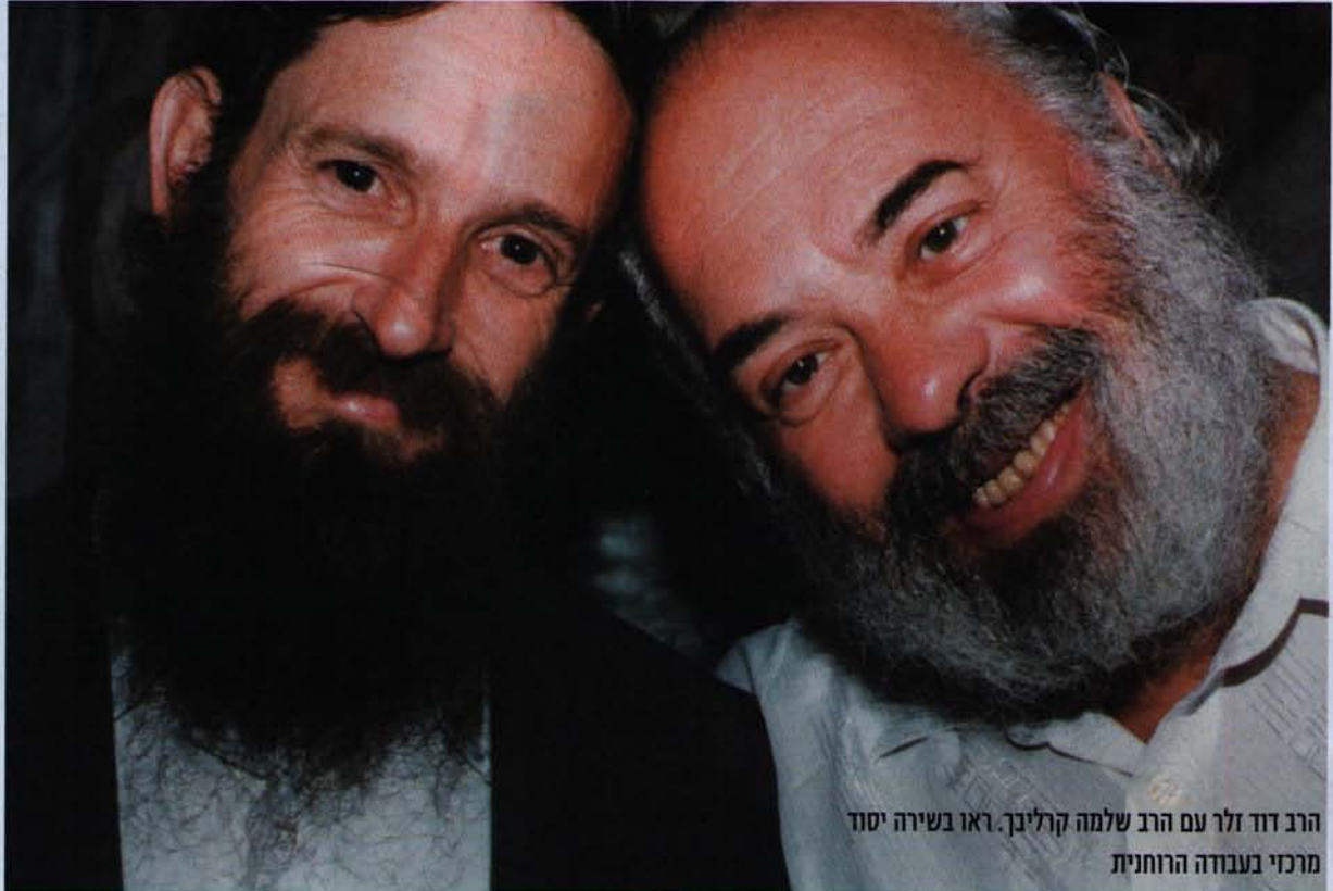
הרב דוד זלר עם הרב שלמה קרליבך. ראו בשירה יסוד מרכזי בעבודה הרוחנית